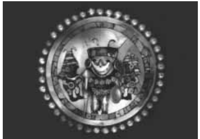
Ohrscheibe mit Darstellung des Fürsten von Sipán zwischen zwei Kriegerern Lambayeque, Museo Arqueológico Nacional Brünning

Anmeldung: ab 22. Januar 2001, bei Schmidt, Dürener Straße 25, Telefon 0 24 03 / 2 23 93