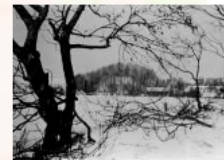
Motte am Mühlenbongert, mittelalterlicher Burghügel in Kinzweiler

Die heimatkundliche Exkursion in Kinzweiler will uns diesmal – nach dem Besuch der Kinzweiler Burg vor 2 Jahren – mit 3 weiteren historischen Zeugen der reichen Kinzweiler Ortsgeschichte bekannt machen.