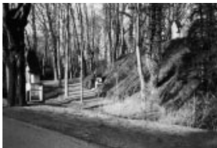
Kalvarienberg mit Kreuzweg in Kinzweiler

errichteten Burghügel gehören zu den 10 größten ihrer Art im Rheinland, wo es gut 300 Motten gibt. Sie stellen für die Stadt Eschweiler und die weitere Umgebung einzigartige, bedeutende Bodendenkmäler dar.