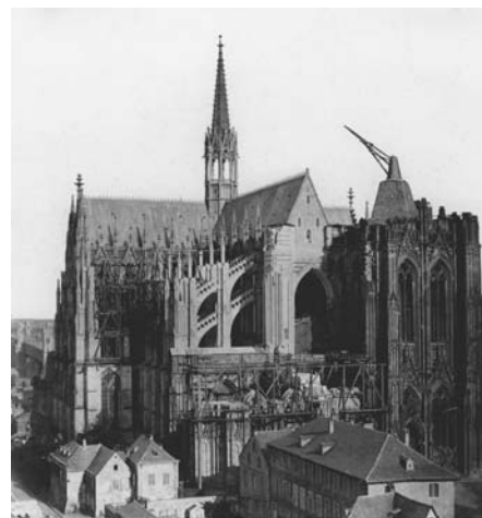
Westfassade des Doms, vor Oktober 1862 Gebr. Schoenscheidt

Dieser bauliche Zustand hatte über dreihundert Jahre Bestand und ist auf vielen Stadtansichten dargestellt worden.