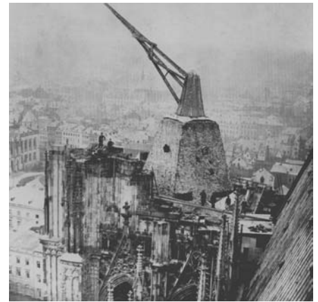
Der Kran auf dem Südturm, 29. Februar 1868 Theodor Creifelds

Erst im 19. Jahrhundert wurden die Bauarbeiten zur Fertigstellung des Doms wieder aufgenommen. Die Gründe für diesen Weiterbau eines sechshundert Jahre alten Gebäudes waren sehr vielfältig und spiegeln für uns sowohl die kulturellen als auch die politischen Verhältnisse der Zeit wieder.