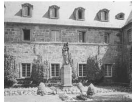
Statue der hl. Odilia

Nach der Besichtigung geht es zum Mont St. Odile (Odilienberg). Der „heilige Berg“ des Elsass liegt am Vogesenrand mit herrlichem Blick über die Rheinebene bis zum Schwarzwald. Das Kloster, von der heiligen Odilia gegründet, ist Ziel zahlreicher Pilger und ein beliebter Exerzitien- und Kongressort.