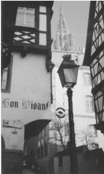
Strasbourg - Une rue pittoresque

Straßburg (Strasbourg) ist heute unser Ziel. Die Hauptstadt des Departements Bas-Rhin und Sitz des Europarates liegt an Ill und Rhein. Stadtbesichtigung und Führung im Münster , eine der schönsten Schöpfungen abendländischer Baukunst. Rückfahrt ins Hotel und Abendessen.