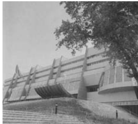
Strasbourg - Palais de l'Europe