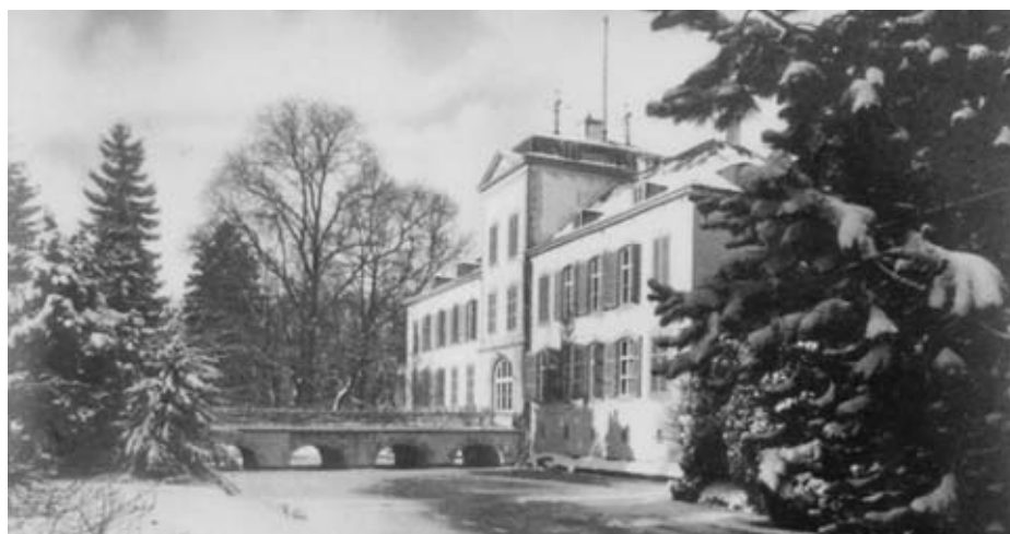
Schloss Rahe (1929)