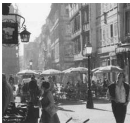
Strasbourg - Secteur piétonnier