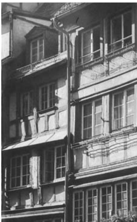
Strasbourg - Maison à colombage