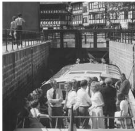
Strasbourg - Promenades en vedette