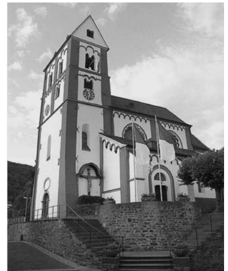
St. Viktor in Oberbreisig

„Blauen Blume“, die Ordensniederlassung der Franziskanerinnen von der Buße und der christlichen Liebe sollen als Stichworte genannt werden.