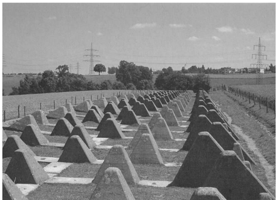
Die fünfzügige Höckerlinie zwischen Geuchter Hof und Amselbach, im Hintergrund die Ortschaft Mühlenbach.

Dies geschieht in dem Film, „You enter Germany“, den wir zur Einführung in die Geschehnisse am Ende des 2. Weltkrieges im Bereich von Hürtgenwald zeigen. Konejung gelang es, nach jahrelangen Recherchen einige der noch lebenden Veteranen in Deutschland und den Vereinigten Staaten zu interviewen sowie bisher noch nie gezeigte Filmaufnahmen aus den US National Archives sowie aus privaten Archiven als Zeugnisse des Krieges für seinen Film zu verwenden.