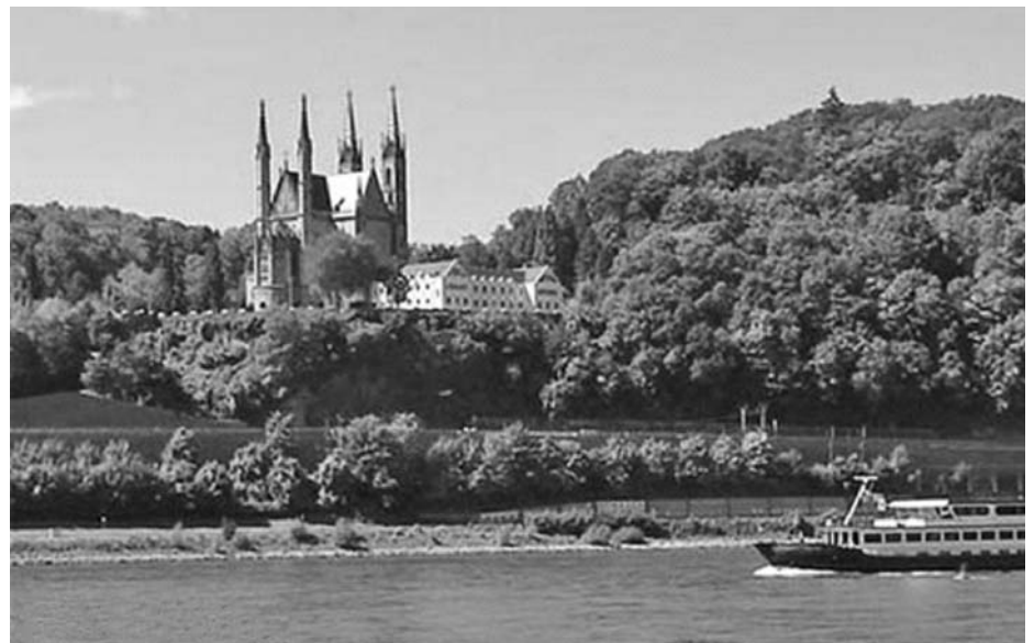
Apollinariskirche in Remagen