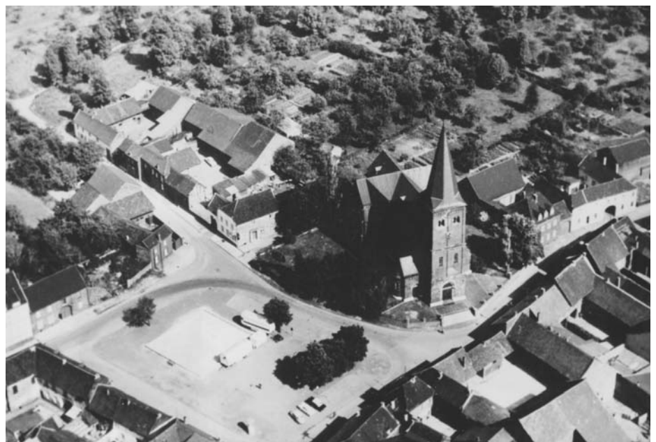
Zentrum von Lohn mit Pfarrkirche St. Silvester, 1960