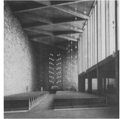
St. Anna in Düren

Säkularisation in Folge der französischen Revolution zu Beginn des 19. Jahrhunderts zu bröckeln und verliert zu Beginn des 20. Jahrhunderts mit den gesellschaftlichen Veränderungen an Bedeutung, da sich die radikalen Ideologien, die diese Zeit geprägt haben, von der Religion abwenden.