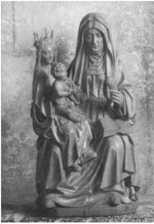
„Hl. Anna Selbdritt“ (um 1500) von Till Riemenschneider, Mainfränkisches Museum, Würzburg