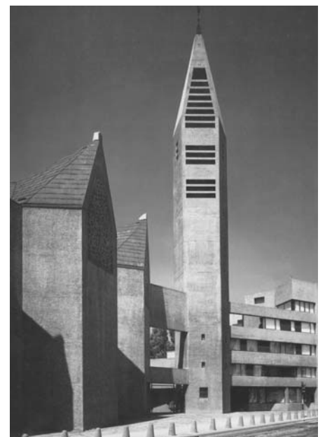
St. Gertrud in Köln

Diese Entwicklungen zwingen die Kirche, ihr Verhältnis zu den Gläubigen neu zu bestimmen. Kirchengeschichtlich manifestiert sich diese Neuordnung in den Beschlüssen des 2. Vatikanischen Konzils (1962 - 1965), die heute noch Gültigkeit besitzen. Einen wesentlichen Aspekt stellen hierbei die Veränderungen der Liturgie dar. Der Priester liest die Messe seitdem nicht mehr mit dem Rücken zur Gemeinde – das Gesicht nach Osten gerichtet –, sondern der Gemeinde zugewandt, hinter dem Altar stehend. Nicht zuletzt hat der Richtungswechsel innerhalb der katholischen Liturgie veränderte Anforderungen an den Kirchenraum gestellt.