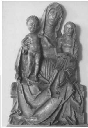
„St. Anna-te-Drieën“ (ca. 1550) Schatzkamer St. Servaas, Maastricht

„Anna Selbdritt“ ist ein altdeutscher Ausdruck für „Anna selbst zu dritt“. Die Bilder und Skulpturen zeigen immer die drei Personen: Anna, die Mutter Mariens, Maria und Jesus als Knaben. Die Darstellung dieser drei Personen, in der sich drei Generationen begegnen (Großmutter, Mutter und Kind), und deren Zuordnung wird vielfältig und faszinierend gelöst, und zwar auf dem Hintergrund der glaubensgeschichtlichen Vorstellungen und Überlieferungen, der religiösen Auffassung des Künstlers und der jeweiligen Kunst-epoche.